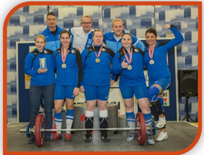
Bild: SK-VÖEST Steel-Girl