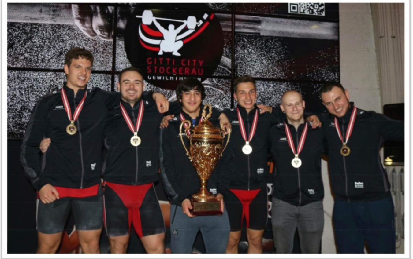
Staatmeister 2017 Mannschaft - WKG HSV Langenlebarn / FAC Gitti City