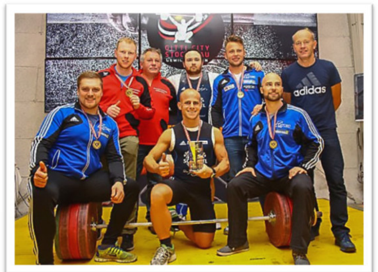
Ranshofen - BL - 3.Platz