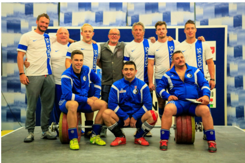
Mannschaft SK-VÖEST Linz I