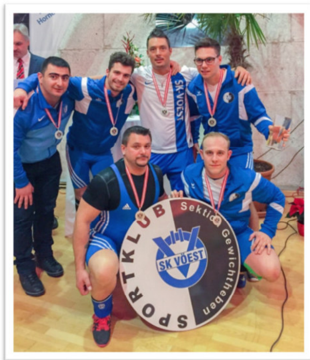
VÖEST - BL - 2.Platz